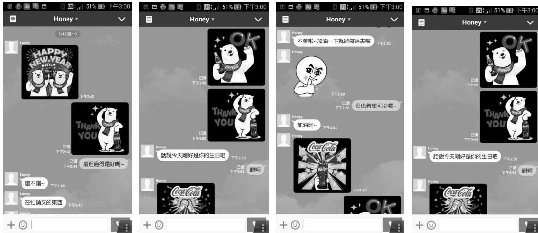
圖 4：貼圖情境對話 1